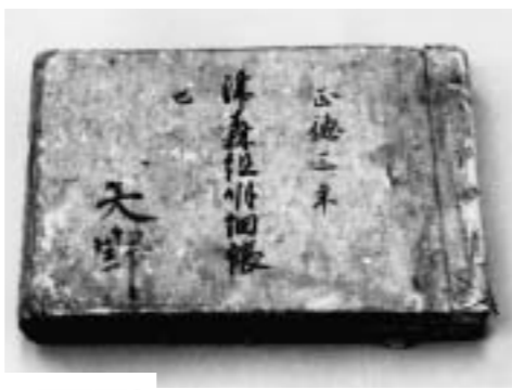
津森組明細帳表紙

肩書きの「門下」はこの田がある場所の小地名である。「中田」は田畑の別とその等級、「六