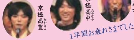
1年間お疲れさまでした。