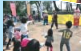
体操は子どもたちに大人気!