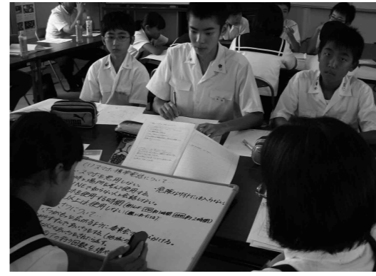
熱心に話し合う児童・生徒

飯山学校群では、8月3日、飯山南小学校で学校群内の児童会役員・生徒会役員・学級委員約60人が参加し、リーダー研修会を開催しました。 ①各学校の実態及び課題発表 各校の児童会・生徒会が取り組んでいる活動や最近の問題点について、アンケート結果を交えながら発表しました。 ②スマホ利用宣言の作成 各校で共通して問題となつているスマホや携帯電話の利用の