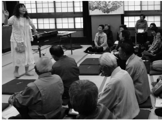
みんなで歌えば笑顔がいっぱい

城坤コミュニティでは、子どもからお年寄りまで、誰もが元気でいきいきと暮らせる「豊かで住み良い、安全安心な六郷の里づくり」を目標に、さまざまな分野での取り組みを行っています。