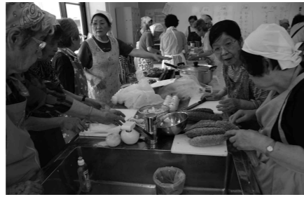
地域内の各世帯で育てたゴーヤでパーティー

●ハンセン病(ハンセン病回復者)に対する偏見や差別の現実に鋭く迫る映画です。ハンセン病について考える機会となれば幸いです。 第1回上映は送迎バスあり。希望者は申し込み時にお伝えください。 コース：綾歌⇨飯山⇨ひまわりセンター 申し込み 9月12日(月)～11月7日(月)に人権課内丸同教事務局へ「参加者名、電話番号、参加上映回」をお知らせください。 ☎24-8811 FAX 23-4073 E-mail jinken-k@city.marugame.lg.jp