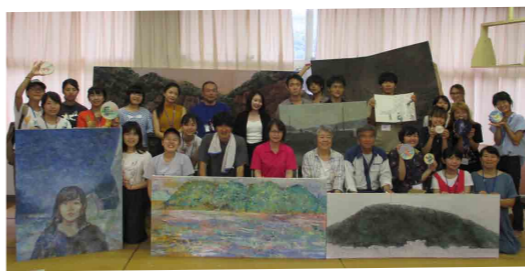
交流しながら作品制作

島での生活には、いろいろ思い通りにならない課題もあります。が、今後も移住の支援を拡大し、島の活性化につなげていきたいと思っています。最後に、毎年温かく学生たちを受け入れてくれる島の人たちに心から感謝しています。