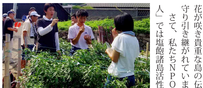
京都大学の学生も「香川本鷹」の栽培体験

島の活性化と若き芸術家の育成を目的としてスタートした「HOTサンダルプロジェクト」は、今年で6年目を迎えました。美術大生が夏の1か月間、本島、広島、手島、小手島に滞在して島の人たちと交流しながら、制作活動を行います。今年のワークショップでは、浜で