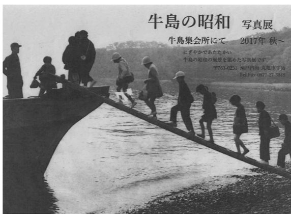
牛島で行われている写真展のポスター

—そのとおりです。塩飽では、島の特徴を生かした伝統行事や新しい観光資源の創出が行われています。例えば、小手島では島の人たちが植えた、一本の木に紅白の花が咲く珍しい「源平桃」が「塩飽」に春の到来を告げます。また、手島では夏になると有志の手で植えられた「ひまわり畑」が、来島者に感動を与えています。そして、牛島では今、島の歴史をたどる写真展が開かれています。このように様々な情報を総合的に、適時に発信すればPR効果も上がり、来島者の増加にもつながっていきま