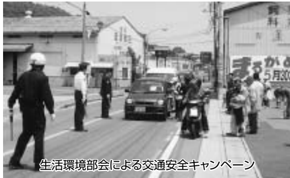
生活環境部会による交通安全キャンペーン