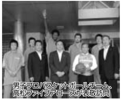
男子プロバスケットボールチーム、高松ファイブアローズが表敬訪問