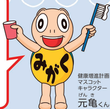
健康増進計画 マスコット キャラクター げんき 元亀くん