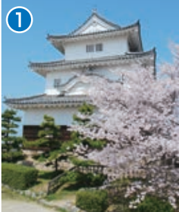
日本一高い石垣、日本一深い井戸、日本一小さな天守閣と、3つの日本一を有する丸亀城です。