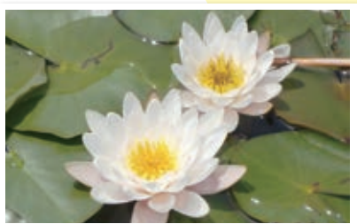
土器川生物公園の、芝生広場や池や林の中で、季節の植物や生き物に出会うことができます。また、ペットと一緒に過ごすこともできます。ペットと一緒にいる際はフンのあしまつ等のマナーを守りましょう。