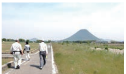
土器川河川敷のグラウンド沿いは木陰が少ないので、日差しの強い時間帯は体調管理に注意が必要です。