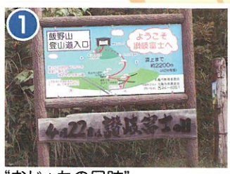
“おじよもの足跡” 「おじよも」とはこの地方に伝わる伝説の巨人の事です。