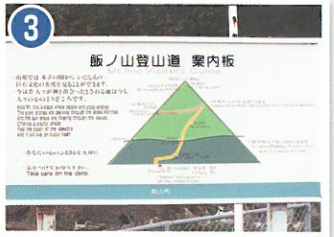
平成17年に「新日本百名山」に選定され、頂上に記念碑が建てられています。