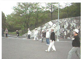
げんき会による準備運動の様子です。

飯山町の楠見池には遊歩道が整備されています。その楠見池周辺を“げんき会”というグループ主催で毎月第3土曜日の午前9時に、飯山総合運動公園ちびっこ広場近くの駐車場に集合して楠見池周辺を歩いています。申込みは不要で、どなたでも参加できます。(小雨決行)お気軽にご参加ください。