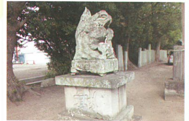
めずらしい子持ちの狛犬。