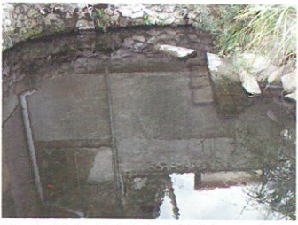
垂水町内の湧水量が多い出水のひとつ。鯉も泳いでいます。