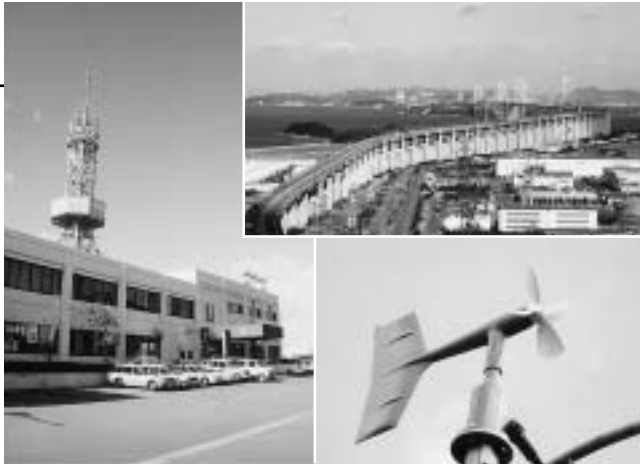
写真左: 本四高速道路(株)坂出管理センター 上: 瀬戸中央自動車道は西風に注意 下: 風速・風向計(多度津特別地域気象観測所)