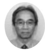
長野課長からひとこと

安全・安心のまちづくりを目指し、公共施設の耐震診断や補強工事に取り組んでいます。