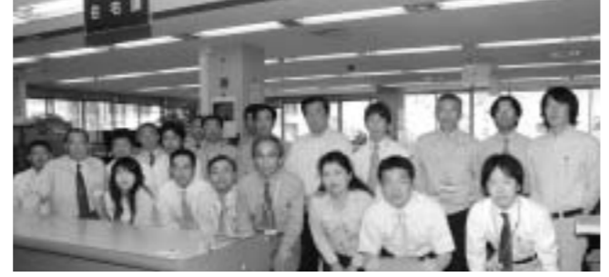
住宅課スタッフ(本館2階)

住宅課は、市民のみなさんに健康で文化的な生活を送ってもらうため、次の業務を行っています。 《住宅担当・建築担当》