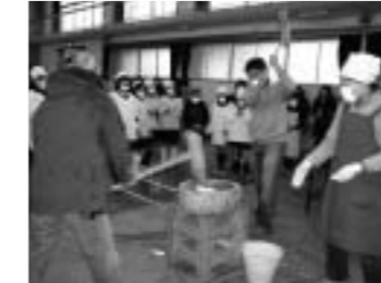
▲おいしいもちができるかな

城坤小学校では、毎年一月下旬に「正月フェスティバル」をしています。これは、お正月の行事を味わうことができるようにと、二十五年以上も前に始まったそうです。正月フェスティバルは、もちつきと親子のふれあい活動の二つの活動をしています。 もちつきは、家庭や地域の人たちにご協力をお願いし、一緒にしています。朝早くから大人たちがもち米を蒸して、もちがつける状態になるまでつけてくれた後で、ぼくたちが順番にもちつきをします。もちをちぎってあんこを入れるのも難しいので、お母さんやおばさんがやってくれました。丸めたもちのみなで食べました。つきたてのちはやわらかく、とてもおいしく満足しました。