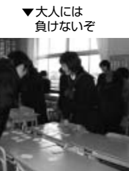
▼大人には負けないぞ

親子ふれあい活動では、百人一首、ちぎり絵、親子ソフトバレーボールをしました。大勢の人とふれあえて良かったです。ぼくは四年生の時に転校して来て、こんな楽しい行事を経験でき、良かったと思います。