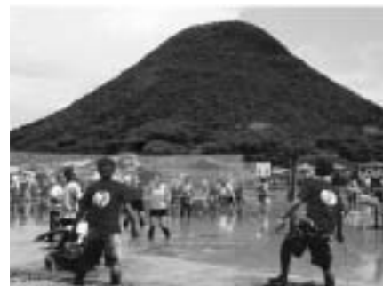
▲ご来場をお待ちしています

http://sky.geocities.jp/doronko2008/ クリック!