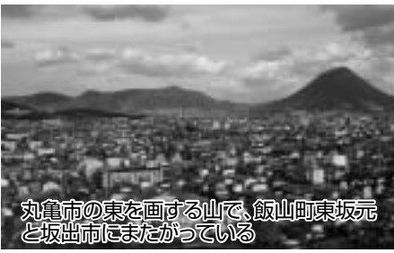
丸亀市の東を囲む山で、飯山町東坂元と坂出市にまたがっている 国指定史跡 城山 《昭和26年6月9日指定》

に立派な屋敷を建てて住んでいた。長者には足の不自由な一人娘がいて、大金をつぎ込んで車道を造り、娘は車に乗って毎日車道からの景色を楽しみ、散歩したという。 西暦六六二年に白村江の戦いで新羅・唐に破れた日本は、西日本の防備を固めるため、九州北部から瀬戸内沿岸に次々と山城を築いた。