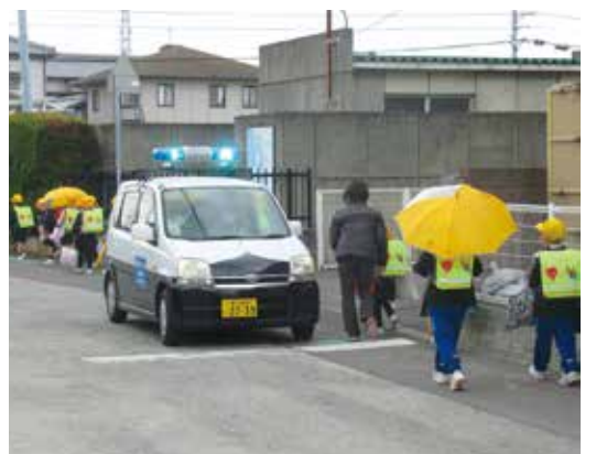
下校中の子どもたちの見守り活動