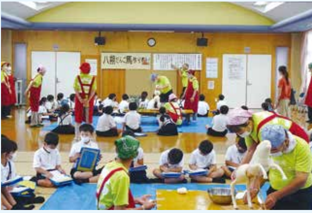
城西小学校3年生を対象に八朔だんご馬づくり見学会

城西小二年生の校外学習（JR丸亀駅）への行き帰りの道沿いを子ども達見守り隊メンバーと一緒に歩きました。児童の登