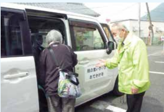
いきいきおでかけ便事業