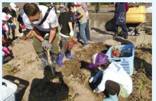
放課後子ども教室事業

いひと時を過ごします。また、三世代交流として、子ども、保護者、高齢者の世代が一緒に物づくりもします。