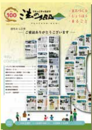
飯山南コミュニティだより 法の郷

地域の情報発信に取り組んでいる飯山南コミュニティ広報委員会の皆さん、おめでとうございます。