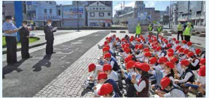
城西小学校2年生の校外学習（JR丸亀駅）に子ども達見守り隊メンバーが同行