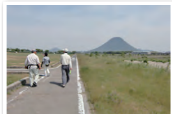
土器川河川敷のグラウンド沿いは木陰が少ないので、日差しの強い時間帯は体調管理に注意が必要です。