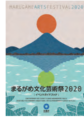
昨年の公式イベントパンフレット