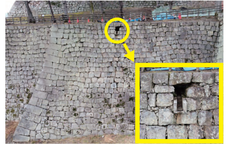
資料館駐車場から見た石垣の様子

丸亀市立資料館の駐車場からお城を見ると、石垣の上のほうにぽっかりと穴が開いているように見えるところがあるのを、皆さんはご存知でしょうか？石垣の石が抜けているのではないかと、心配される声を聞くことがあります。さて、この穴は何でしょうか？近づいてよく見てみると、石垣の奥から溝が石垣の外にまで伸びている様子がよくわかると思います。実はこの溝は排水溝で、排水溝が設置されている空間が遠くから見ると、穴が開いていたように見えていたのです。