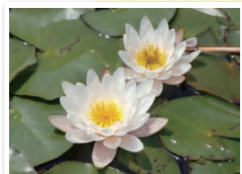
土器川生物公園の芝生広場や池や林の中で、季節の植物や生き物に出会えます。ペットと一緒に過ごすこともできます。 ※ペットと一緒にいる際は、フンの後始末などのマナーを守りましょう。