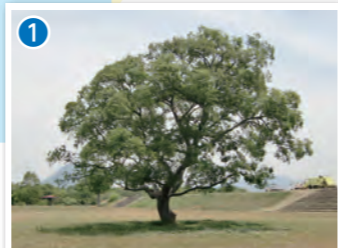
映画「きなこ」のロケ地になった場所もあります。5月末～6月初旬には、蛍が見頃になります。