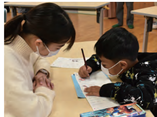
3月6日、インターン活動の一環で、市内外の大学生6人がにほんごひろばを訪問しました。ボランティア活動の見学後、実際に子どもたちに勉強を教える学生も。「今までこうした学習支援活動に参加したことがなかったけれど、とても楽しかった」、「またこんな活動があればやってみたい」と話してくれました。大学生の訪問に、ボランティアの皆さんからは、「若い世代から活動に興味をもってもらえて、うれしい」、「子どもたちも、自分たちと近い年代の人が来て、楽しかったと思う。機会があれば、ぜひまた来てほしい」と喜びの声があがっていました。

ボランティアに参加する前は塾の講師をしていました。ここに来る子どもたちは、真面目で素直な子たちが多いので、教えがいがありますね。一緒に活動するボランティアの人たちも、こうしたらもっといいかもとか、お互いに助け合える関係なので、気楽に続けています。