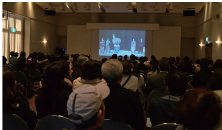
新成人の家族も別会場から見守りました