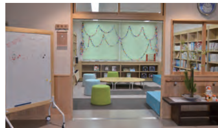
新センターの図書室を「まちライブラリー」に

図書室を多くの人が集まるまちライブラリーにするとともに、広くて便利になった新センターを生かし、子どもから大人まで地域の人みんなが楽しめる施設になるよう、城坤コミュニティの取り組みは続きます。