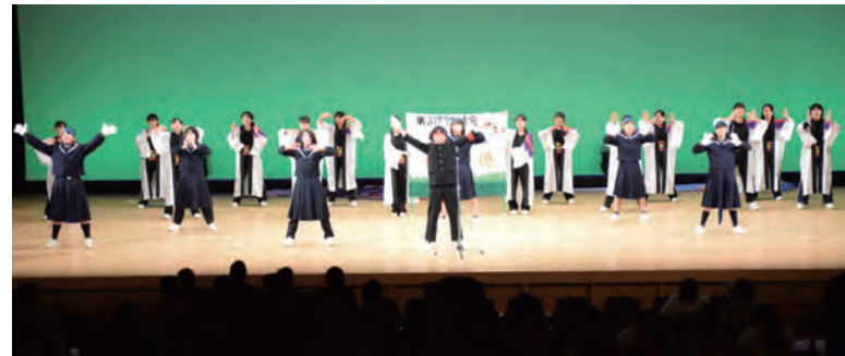
新成人をお祝する南中学校生徒会の皆さん