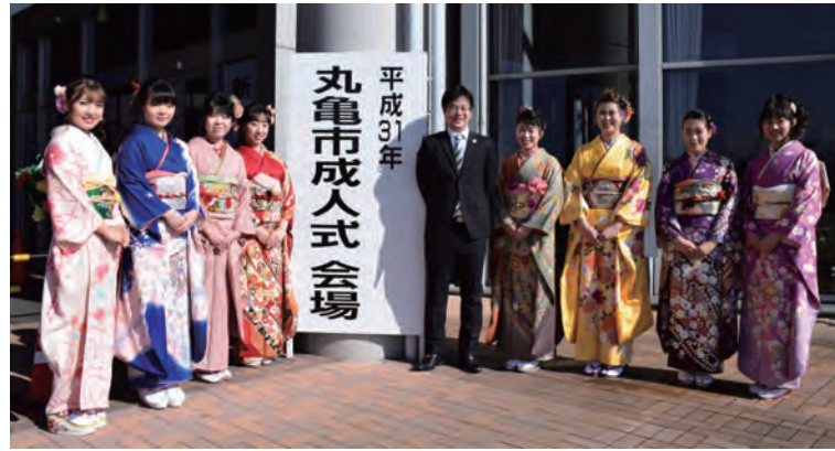
アトラクションの企画・運営を担当した成人式実行委員の皆さん