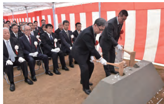
1月11日金に行われた安全祈願祭