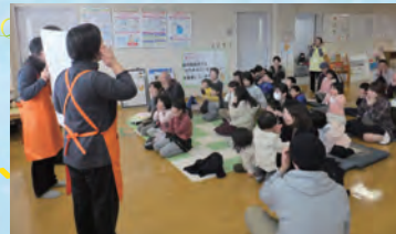
お口のマッサージ