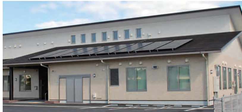
昨年11月末に完成した新センター