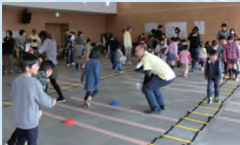
みんな楽しく運動