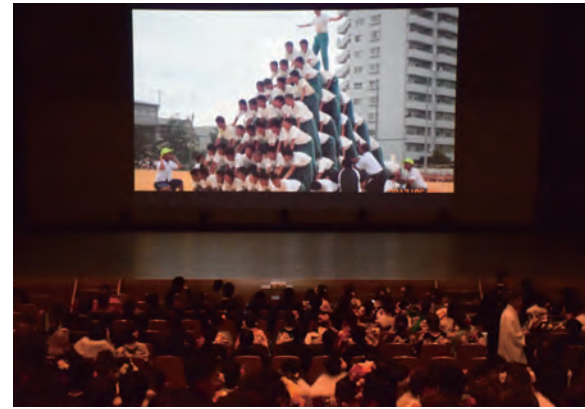
歓声が上がった懐かしい写真のスライドショー