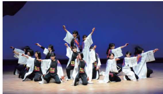
京極発幸舞連による祝の舞