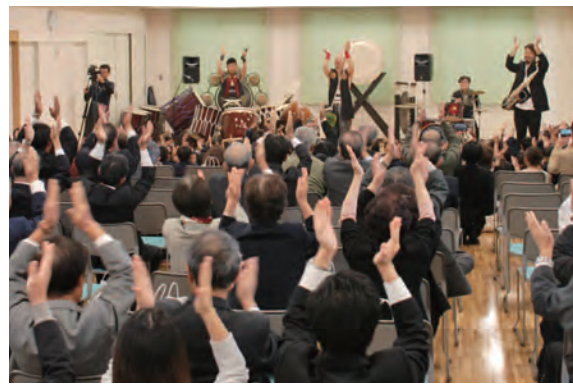
落成式が盛り上がったパフォーマンス