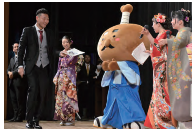
豪華景品が当たる抽選会で当選!!