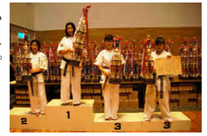
女子も活躍中です

た教訓を授かりました。まだまだ未熟な私ですが、空手は、私の人生の大きな支えになっています。 さて、第6回JKJO全国選抜指定大会(第8回JKJO全日本ジュニア大会)を、6月に善通寺市民体育館で行いました。幼稚園児から高校生まで、四国内外から昨年より百人多い、500人の選手が参加。丸亀市からもおよそ80人が参加して、壮絶な代表権争いとなりました。多くの人のご指導とご協力に感謝し、来年の大会開催に向けて精進してまいります。 さて、東京オリンピック開催を6年後に控え、私たち空手関係者の願いは、「2020年東京オリンピック・パラリンピックでの空手道の正式種目入り」です。丸亀の選手が、表彰台上がる姿を夢見ています。 次回大会は、6月21日(日)に善通寺市民体育館で行います。