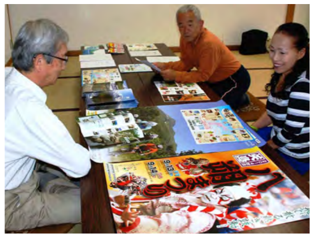
交流のアイデアが次々と……

に「市民主導の文化交流をしたい」の趣旨で駄文を寄せました。そして、去年夏、これ縁と思つて