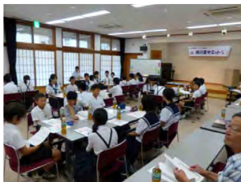
みんなで「桃の里サミット」

話し合いを通して、さわやかなあいさつを広めていくことやいじめをなくすことの大切さを再確認し、その誓いとして「桃の里あいさつ宣言」「桃の里いじめゼロ宣言」を発表しました。これから、この宣言をもとに、各校での取り組みを広めます。