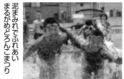
泥まみれでふれあい まるがめどろんこまつり