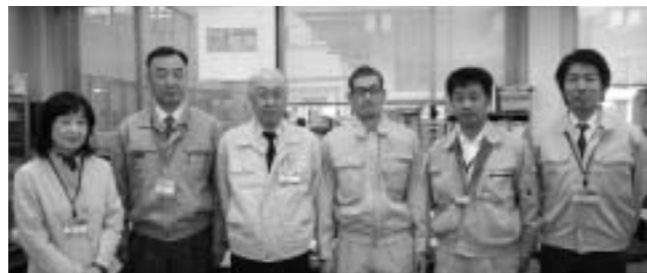
農業委員会事務局スタッフ