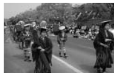
十器「ミニミニ」にちなむ まるがめ時代絵巻 第58回丸亀お城まつり