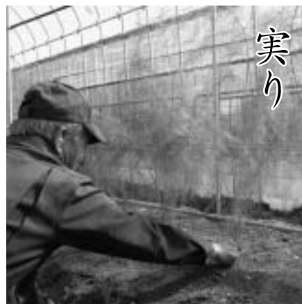
アスパラガスのハウス栽培