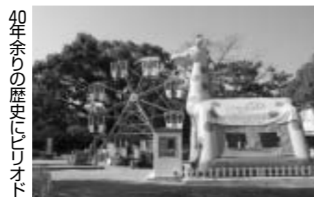
40年余りの歴史に「レリオ」

丸亀市総合計画スタート まち歩き「ちよっと寄り道こんぴら街道」 にぎわいと憩いの場 スペース114完成