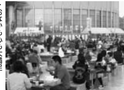
おなかもちも大満足