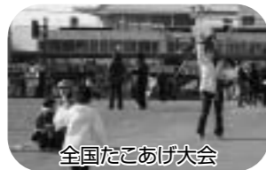
全国たこあげ大会