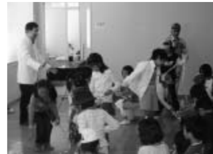
笑顔も健康づくりのひと

「まるがめ健康づくりフェスタ2007」がひまわりセンターで開催されました。1,500を超える来場者は、健康測定や体力測定コーナーで自分の体を再認識。多彩な催し物があり、飲食コーナーでは手打ちうどんなども出店しました。