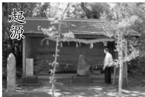
垂水の起こり 時雨松の碑