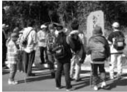
石の由来も見所のひとつ