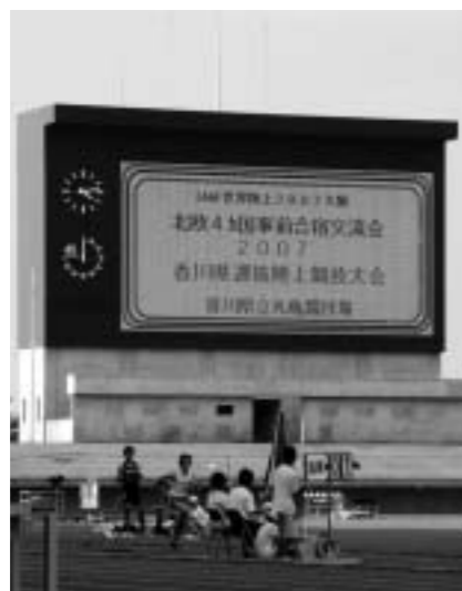
トップアスリートと交流