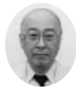
竹内局長からひとこと