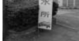
市内7箇所に給水所を設置