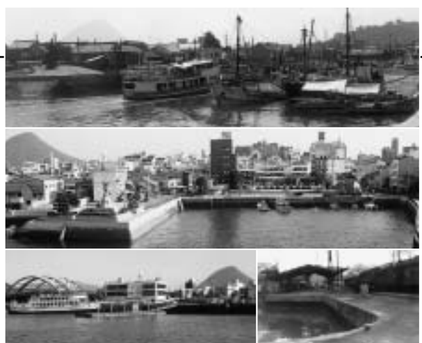
写真上：下津井からの船が入港。港内には木造船が多い(昭和38年7月) 中：港の奥は埋め立てられ、市営駐車場やみなと公園に 下左：丸亀港合同待合所(昭和59年3月完成)と本島行きフェリー 下右：丸亀駅東の荷揚げ場と高松行きSL列車(昭和39年2月)