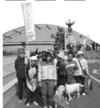
「きな子」と一緒に「こんぴら街道」を散歩