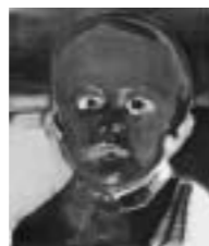
マルレーネ・デュマス(乳児(2)) 2006年 油彩・カンヴァス Marlene Dumas "Baby (2)" 2006