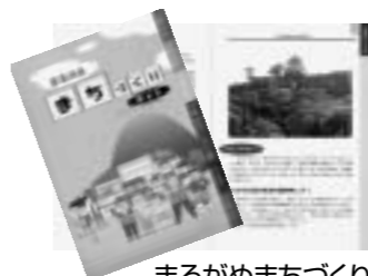
まるがめまちづくりガイド