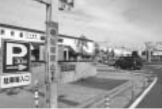
標識などを増設し啓発を強化