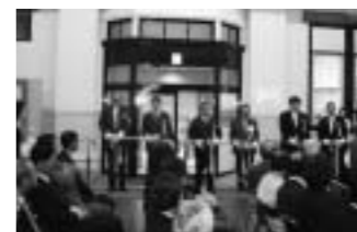
旧百十四銀行丸亀支店を改装「スペース114」