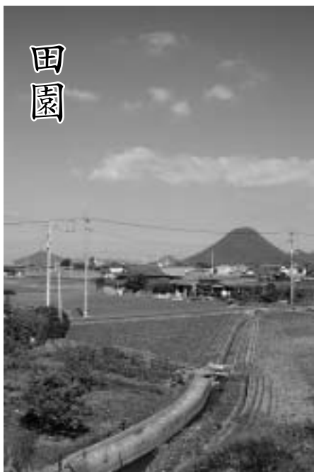
上池より垂水地区を望む