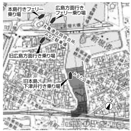
《丸亀港内の埋め立て年》 ■昭和40年 ■昭和51年 ■昭和62年

四国の経済は、古くから阪神方面との結びつきが強く、貨物輸送において、船舶や鉄道が利用されてきた。海で分断された四国と本州間の鉄道貨物の輸送は、明治四十三(一九一〇)年に国鉄の宇高航路が開設された時から小口貨物はすべて港で積み替えていた。大正十(一九二一)年から貨車を舁(おび)き(貨物や乗客を運ぶ小舟)に積み、宇野―高松間を曳船(ひねぶね)で運んだ。一九五〇年代以降はトラック輸送が増加しはじめ、昭和二十九年四月に、初めてフェリーボートが本州と四国の間、明石―岩屋(淡路島)・福良(淡路島)―鳴門間に就航した。当初のフェリーは自動車航送専用であったが、三十六年から一