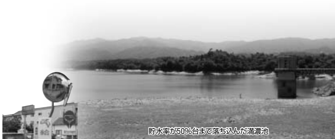
貯水率が50%台まで落ち込んだ満濃池