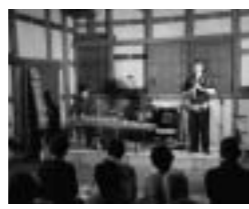
大手門で初の演奏会