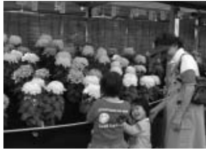
きれいな菊と背比べ