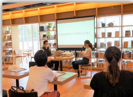
U25 と考えるセンキョとジブン(8/13)