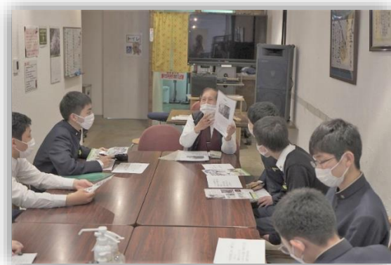
まちあるきインタビュー（4月）