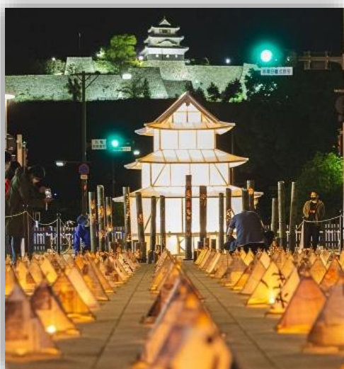
丸亀まちあかり 2022 (10/8)