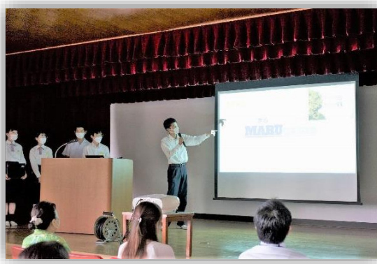
学校で企画発表会（6月）