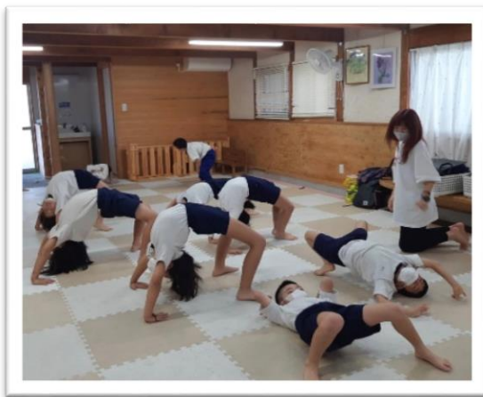
フィットネス教室