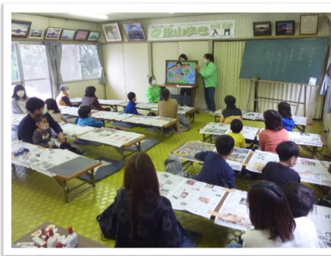
飯野山のおじよも伝説の紙芝居