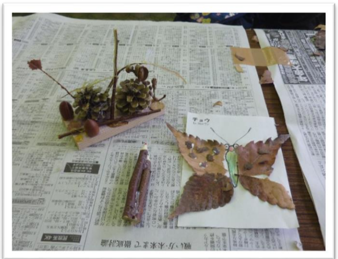
小枝、葉っぱを使ったクラフト、樹木の役割や大切さの話をしています。