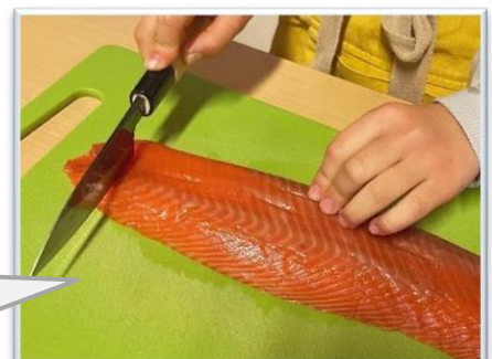
【オンライン調理実習】