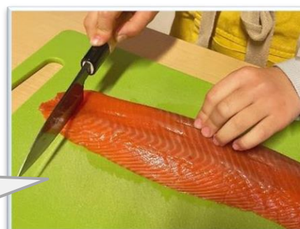
【オンライン調理実習】