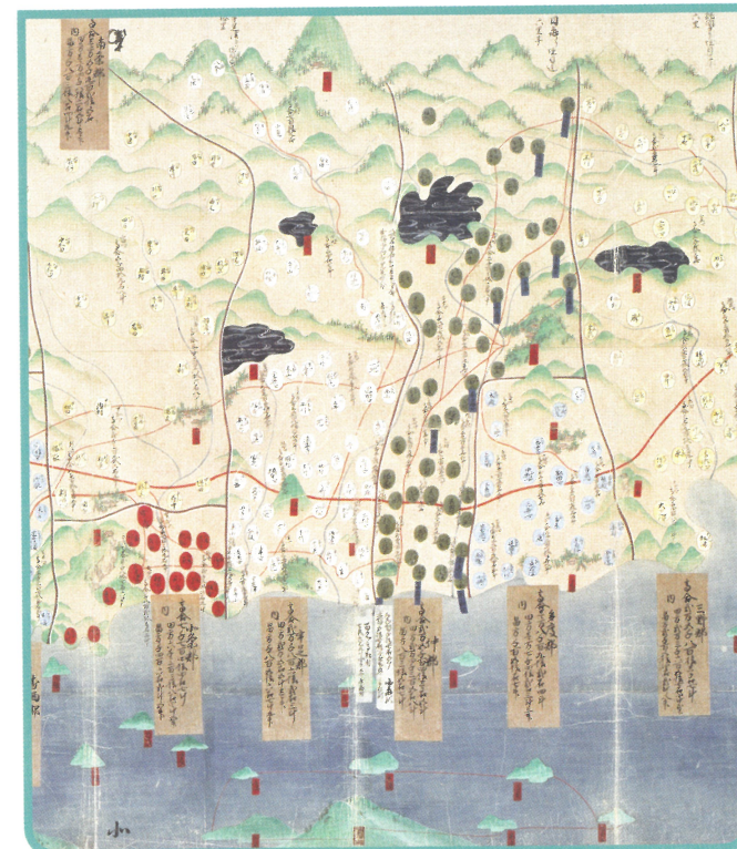
讃岐国絵図(部分) 丸亀市指定文化財