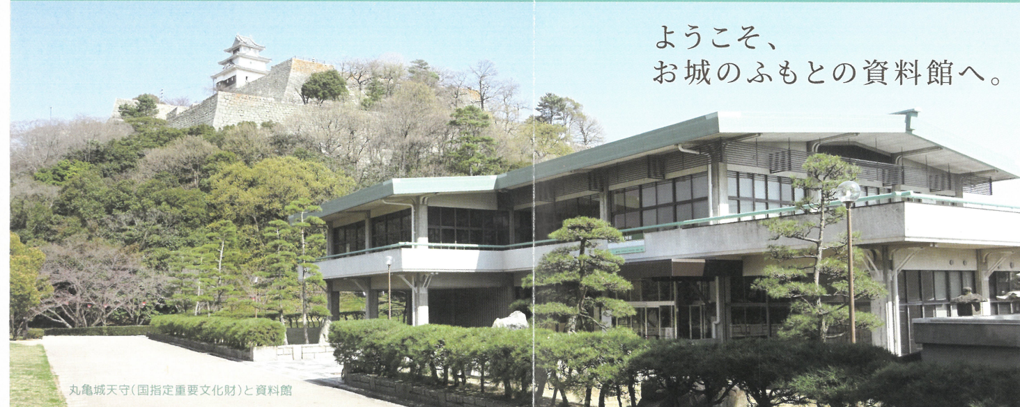
丸亀城天守(国指定重要文化財)と資料館