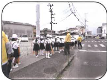
地域探検引率補助