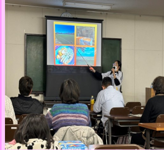
丸亀市国際理解講座