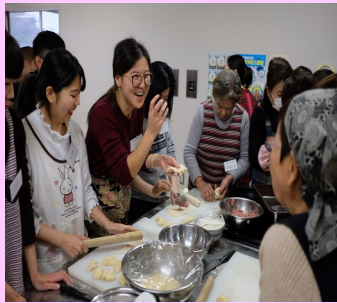
国際交流クッキング