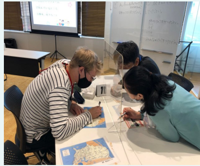
やさしい日本語交流会