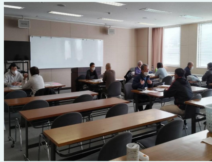
日本語水曜教室 にほんご日曜教室