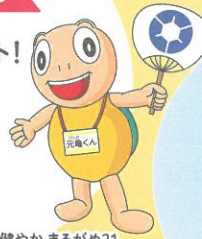
健やかまるがめ21 マスコットキャラクター 元電(げんま)くん

当日、アンケートに答えてお土産ゲット！ 裏面の元電くんの色ぬりをして 持って来てくれた 小学生以下の子どもには プレゼントがあります