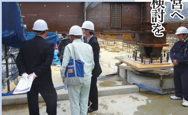
新庁舎をはじめ、続く大型事業計画