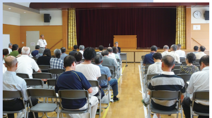
コミュニティセンター市長懇談会

緊急事態宣言発出直前の庁議で、コミュニティセンター市長懇談会の開催を各部へ依頼しているが、各種の行事が中止となる中、開催に異議を唱える職員はいなかったのか。今年度の開催について、現時点での考えは。