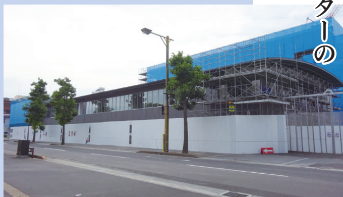
建設中の「市民交流活動センター」