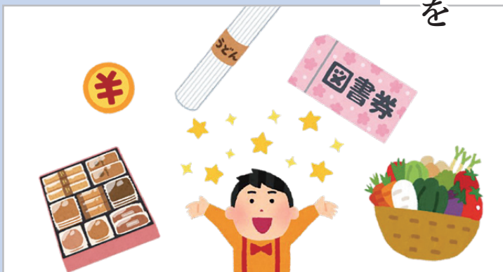
「支援」にはいろいろな形があります

新型コロナウイルス感染症拡大により、学生が経済的に困窮し、学業の継続や生活の維持に支障を来している。国の支援も十分とは言えない中、本市独自の判断で支援することが必要ではないか。本市出身の学生への支援策について、市の見解は。