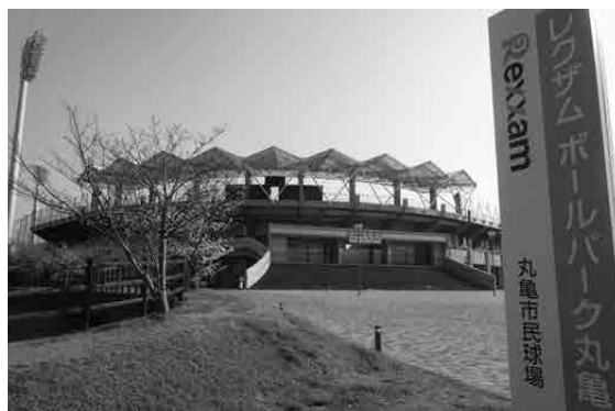
新しい愛称はレクザムボールパーク丸亀

球場として、これまでグラウンド、屋内練習場とも高い稼働率でご利用いただいている。今後、も野球場として高いクオリティを維持しつつ、来場者数を増やすために、プロ野球など大きなイベントの開催誘致に取り組む。また、市民に親しまれる球場とするために、親子でピクニックなどを楽しめる芝生広場の利用促進、地域団体や民間企業などと連携したイベントの開催などの取り組みを進めたい。