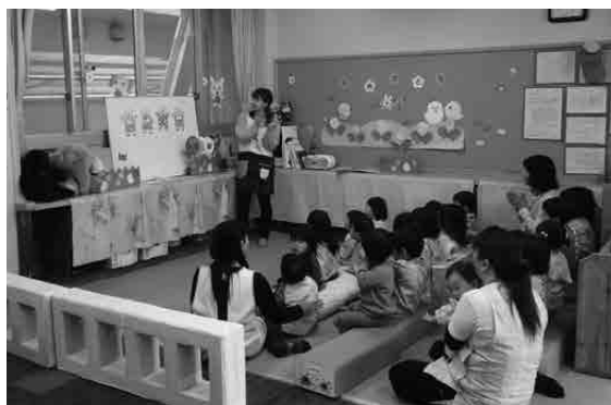
待機児童解消に向け保育士確保を

市長 本市では1クラス最低1人の正規職員の配置を目指し、計画の範囲内で保育士の採用に努めているが、すべてのクラスを正規職員で担任することはできていない。保育士不足の要因として、業務に見合う所得が得られず、資格を持っていても保育職に就かない方が多いことが考えられる。市では、国が創設した保育体制強化事業を活用するほか、私立園に勤務する保育士の賃金に一律30000円の上乗せを行う独自の補助金制度を創設し、保育士の処遇改善を行うことで待機児童解消に向けて保育士確保に努めたい。