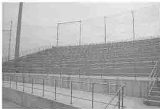
グループで楽しめるピクニックデッキ

ていく予定です。また、災害時 避難施設として防災備蓄倉庫、 耐震性貯水槽なども整備してい ます。