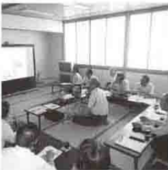
東小川児童センター

東小川児童センターでは、指定管理者から管理や運営状況の説明を受けました。意欲的に運営されていることが伝わりました。