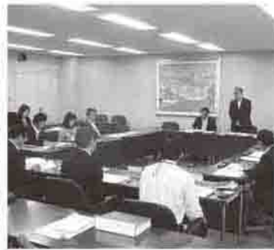
委員長のあいさつ