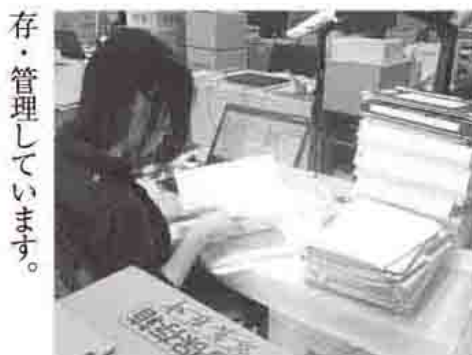
歴史的価値を精査中

存・管理しています。 これらの記録や資料は、過去 の政策決定の過程の検証や、詳 細に分析して歴史認識を深める ために活用します。