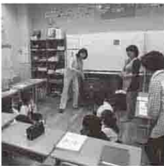
日本語適応支援教室

飯山学校給食センターでは施設概要とこれまでの異物混入事故の検証と対策について説明を受け、給食を試食しました。異物混入対策として金属検出器を設置しただけでなく、目視での