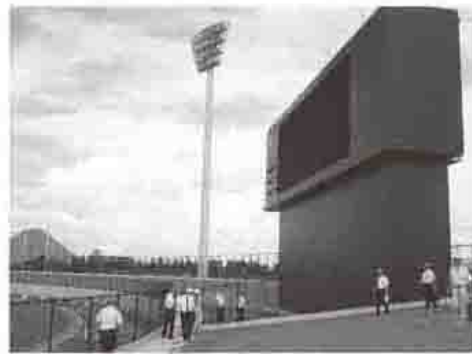
LEDフルカラーのスコアボード

ていく予定です。また、災害時 避難施設として防災備蓄倉庫、 耐震性貯水槽なども整備してい ます。