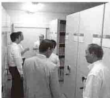
適切な管理に必要な書庫

文書館では、これまでに作成 された記録で保存期間を過ぎた 物の中から、重要な物を評価・ 選別して収集し、地域住民に利 用してもらえよう、適切に保