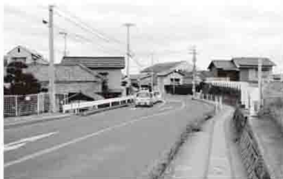
川西町の春日交差点

の要請や道路パトロールによる比較的小規模な補修と、経年劣化などによる規模が大きく計画的な補修とで対応している。限られた予算の中で危険度などに応じて緊急度の高いものから早期に整備するとともに、状況に応じて優先順位をつけることで、利用者の安全・安心に向けて取り組んでいる。比較的小規模なものや緊急度の高いもの、改善要望があり状態の悪いものは、ほぼすべて対応できているが、規模が大きい計画的な補修は約30%の進捗状況である。また、春日交差点については、これまで管理者である県に対し交差点改良の要望を行ってきたが、交