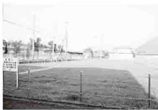
市有地を有効活用

ストを最小化しつつ、最大の効果を上げるといふ考え方で導出した公共施設白書作成の取り組みについても、企画財政部を中心に進めており、今後は、これを市有財産の活用方針の検討に生かしていきたい。