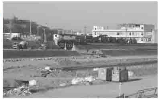
土器川（城東小学校付近）の工事