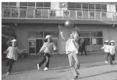
寒くたって、元気に遊ぶよ

所からの応募が見込めないことから、平成24年度に塩屋、塩屋北保育所を統合し、社会福祉協議会による民営化が最善と判断した②新塩屋保育所開園時の児童数を200人と想定した場合、民営化による削減額が4000万円、統合による削減額が2000万円程度になる。保育サービスについては、現在の公立保育所の保育内容の継承を基本に、公立保育所での実施が難しいゼロ歳時保育や延長保育等を確実に実施してもらえ③公立保育所の運営や保育内容を十分引き継ぐことができ、一定期間の引き継ぎ保育が可能である。また、役員が市内団体の代表者等で構成されており、市民ニーズにより一層こたえられる保育が期待