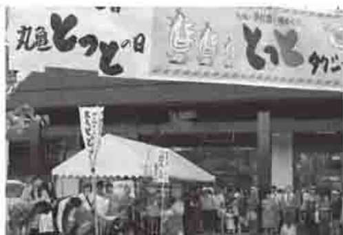
10月10日は「とつとの日」骨付鳥

組織するさぬき瀬戸大橋広域観光協議会と連携を取りながら、観光施設や観光資源の整備、開発を行っている。今後は、金毘羅街道の整備やまち歩き事業をさらに改善するなど、ハード、ソフト両面から取り組み、丸亀と琴平との連携を深めていきたい。また、とつとの日や讃岐富士の日には、ホテル、飲食店、店舗、タクシー業界の協力を得るなど、民間観光産業とタイアップした事業を増やしていきたい。さらに、ニューレオマワールドなど丸亀市を中心とした観光圏の情報発信や地域ブランドの営業活動を積極的に行うとともに、県や近隣自治体と連携して観光客の誘致に努め、滞在型観光を推進していきたい。