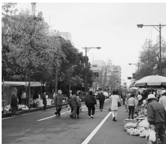
長年市民のみなさんに親しまれている日曜市