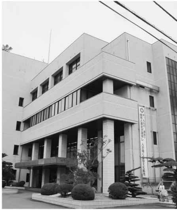
市民総合センターの空き部屋の有効活用を

していただきたい。 ○税金入が過少見積もりとならないよう適正な予算計上をしていただきたい。