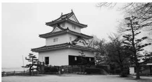
市民の憩いの場所“丸亀城”