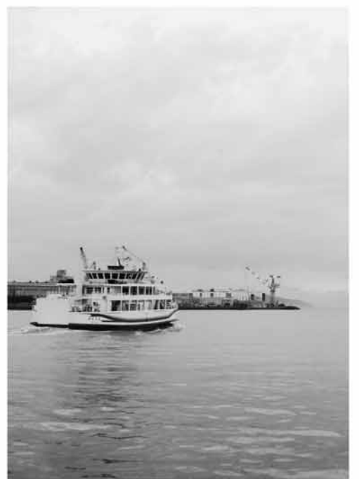
離島住民などの輸送体制の充実を