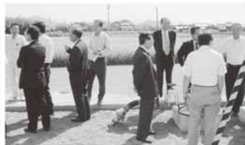
飯山町の深井戸を視察する決算委員