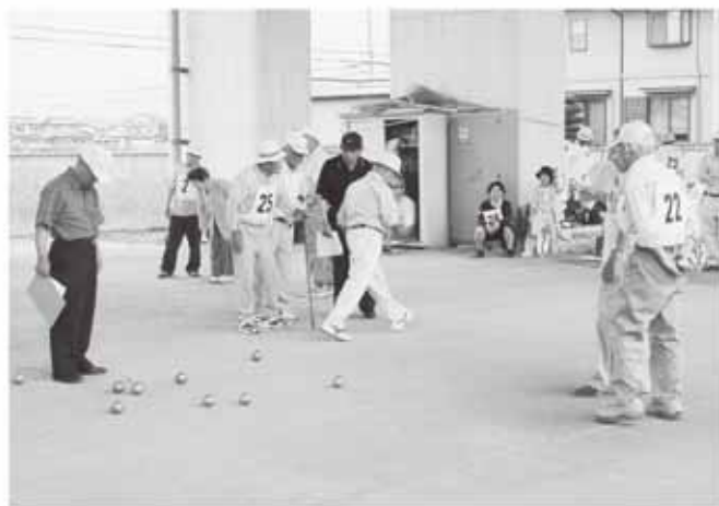
気の合う仲間とプレーするのが健康の源です