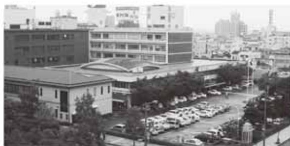
市民と一緒に“魅力ある”丸亀に