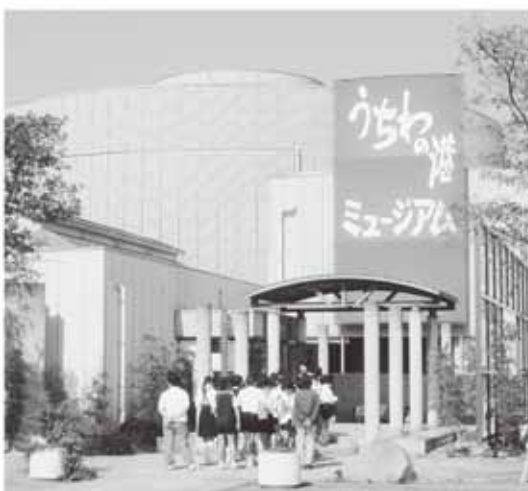
4月から指定管理者制度を導入します