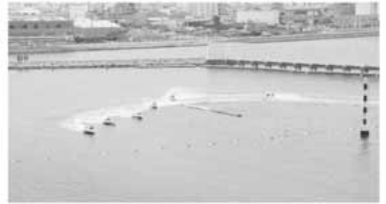
競艇の売り上げ増に期待を