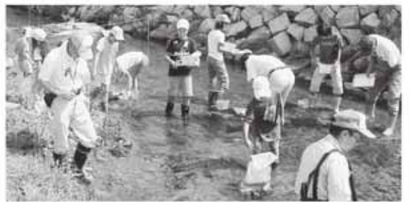
生き物がたくさん住むきれいな川に