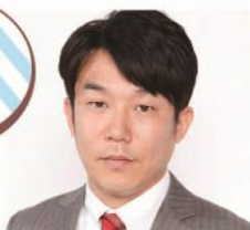
ペナルティヒデさん