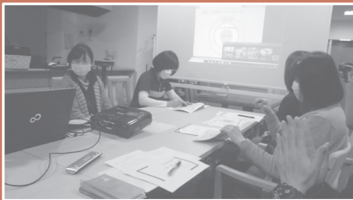
▲その他の取り組みとして、複数拠点とネットでつなぎ、研修を実施