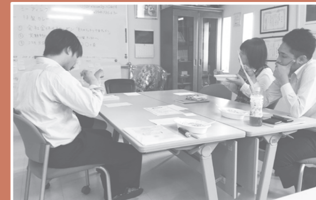
▲写真③ ランチミーティングの様子