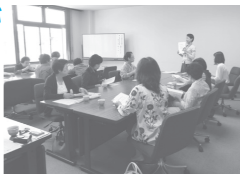
(丸亀商工会議所女性会の出前講座の様子)