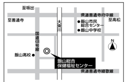
飯山総合保健福祉センター 飯山町下法軍寺581番地1