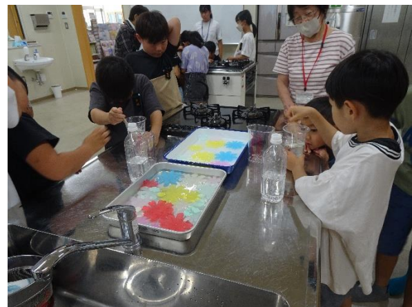
サイエンス教室 8月20日