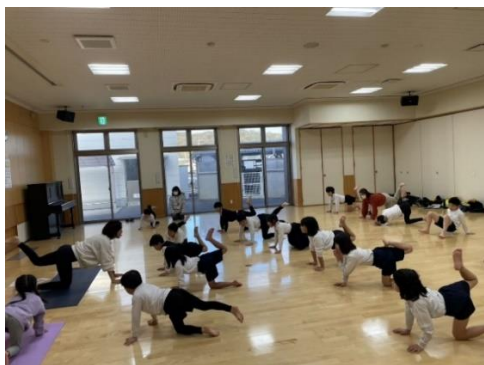
今年度初めてこどもヨガに挑戦しました