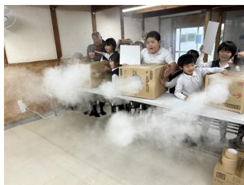
サイエンス教室は、いつもわくわくドキドキ感でいっぱいです