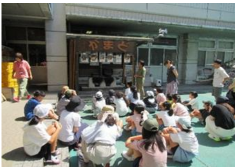
ふるさと学芸館探検ツアー