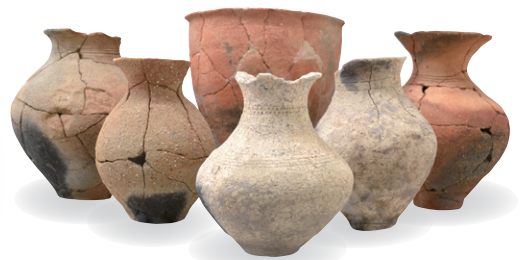
中の池遺跡 やよいどき 弥生土器