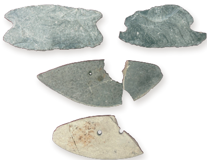
中の池遺跡 いしぼうちよう 石包丁

丸 亀市には約500か所の遺跡が確認されており、現在も市内各地で発掘調査がおこなわれています。中でも、中の池遺跡(弥生時代)、快天山古墳(古墳時代)、丸亀城および城下町(江戸時代)といった代表的な遺跡について、出土資料や調査成果を用いてご紹介します。さらに、市内の遺跡を紹介するだけでなく、発掘調査はどのような方法で進められているのか、発掘調査をおこなうことはなぜ大切なのか、といったことについてもあわせて解説します。この展覧会を通して、埋蔵文化財や考古学に対する関心を深め、地域の魅力を再発見してみましょ!