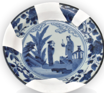
丸亀城跡(大手町地区) そめつけざら 染付皿