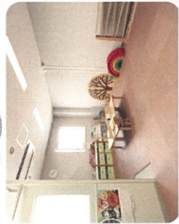
子ども連れでも安心です