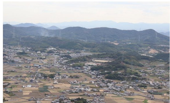
飯野山から見た『はんざん桃源郷の里』