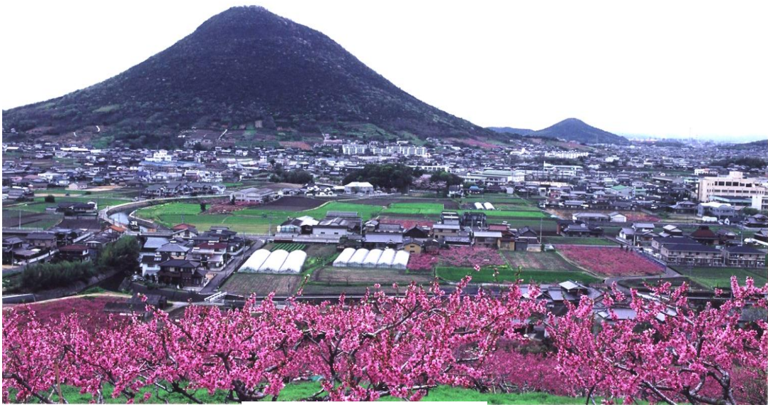
楠見地区から見た飯山北地区

本地域は、丸亀市の南東部に位置し、1年を通じて気候温暖でこれまで大きな災害は少ない。坂出市との境界には、高松自動車道の一部が通過しており、西に土器川、中央に大東川が流れ、北に飯野山、北東・東南部は小高い山が連なっている。