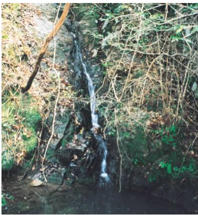
ことがたき 琴ヶ滝

「琴ヶ滝」は、綾歌町の南部に位置する森林公園のほぼ中央にあり、美しいヒノキの林の中で神秘的な趣を呈しています。この滝は、長さが約 100m あり、猫谷池を経て、中大東川へ流入しています。岡田甚句集の名所古蹟ずくしでは「愛宕の滝と銚子滝。雄滝雌滝の琴ヶ滝」と謡われ、古くから景勝地として語り継がれています。