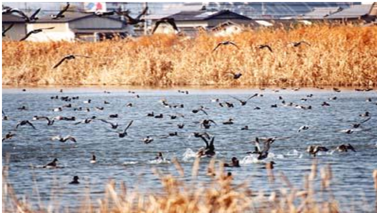
たいいけ 太井池の水鳥