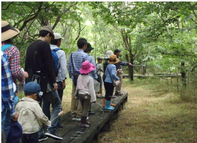
土器川生物公園での自然観察会

市民アンケート調査などによると、自然環境に対する意識は中心部に丸亀城（亀山公園）があることなどから、「自然環境が豊かである」と感じている人が多いです。また、将来の丸亀市の姿として、「河川や森林などが適正に管理され、自然環境が良好に保たれている」といった自然環境の保全に対する関心が高いです。全ての市民が、普段の生活において身近に自然を感じられるような施策を進め、「豊かな自然と身近にふれあえるまち」を目指します。