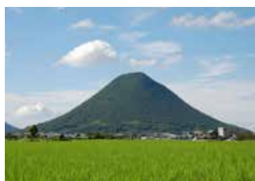
写真11 飯野山（讃岐富士）