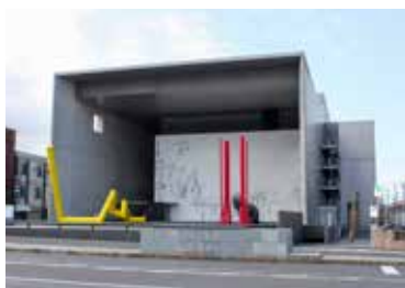
写真6 猪熊弦一郎現代美術館