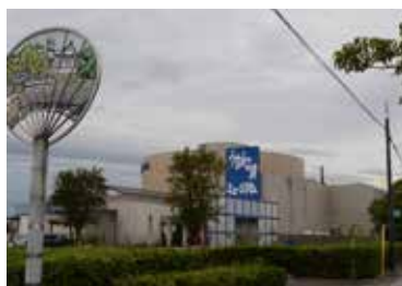
写真7 うちの港ミュージアム