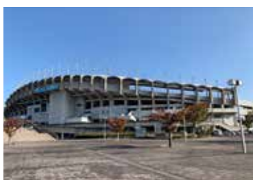
写真9 香川県立陸上競技場