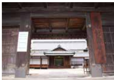
写真4 塩飽勤番所跡（国史跡）