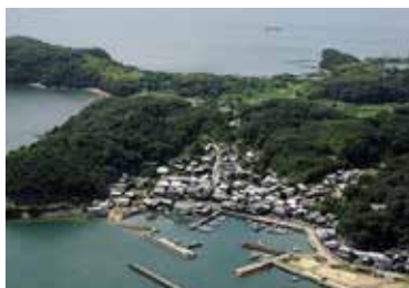
写真3 笠島伝統的建造物群保存地区（国重伝建）

文化施設では全国的にも有名な丸亀市猪熊弦一郎現代美術館があるほか、丸亀市立資料館や、本市の伝統産業であるうちわづくりをテーマにした「うちの港ミュージアム」がある。レジャー施設としては、臨海部に「ボートレースまるがめ」があり、多くの人でにぎわっている。市南部には市内最大の民間レジャー施設であるNEWレオマワールドがあり、中心市街地の南西には香川県立丸亀競技場や丸亀市民球場等のスポーツ施設も整備されており、市民の利用だけでなくJリーグ（サッカー）やプロ野球等のスポーツ観戦も可能となっている。飯野山は多くの登山客で賑わっている。