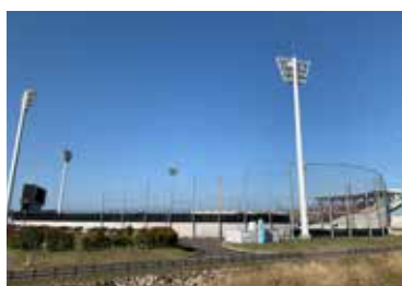
写真10 丸亀市民球場