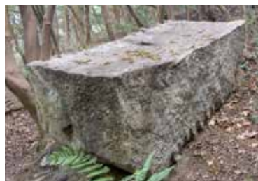
写真5 塩飽本島高無坊山石切丁場跡（市史跡）