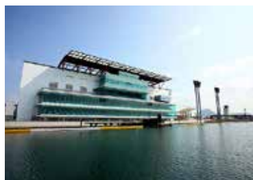
写真8 ボートレースまるがめ