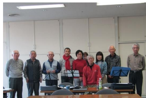
丸亀中央生涯学習クラブ [丸亀ハーモニカクラブ]

その成果は、生涯学習まつりやコミュニティまつりで住民に披露するなど、地域貢献にも活かされています。学習の輪が広がることで、人やまちが元気になり、生涯学習を通したまちづくりの推進につながっていきます。