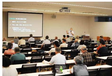
郷土にまつわる歴史講座 [中央図書館]