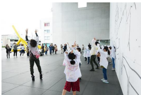
ダンスワークショップ [丸亀市猪熊弦一郎現代美術館]