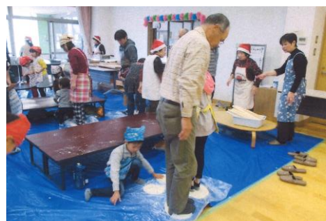
民生委員による「ふれあい交流会」 [東小川公民館]