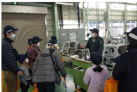
四国職業能力開発大学校見学 [市民学級提案型講座]