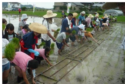
田植え体験 【川西コミュニティ】

子どもたちが地域社会で健やかに育つには、多様な人と関わり、様々な場面で、多くの経験を重ねていくことが大切です。