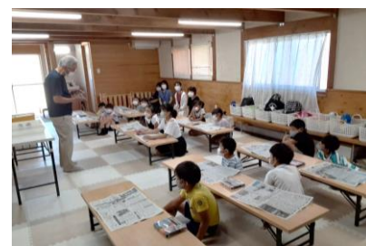
サイエンス教室 [さぬきっずコムシアター]