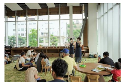
中央図書館おはなし会 [マルタス]