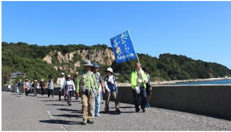
いろは石ウォーキング [広島コミュニティ]

市内の各社会教育施設を拠点に行われており、地区コミュニティでは「生涯学習推進員」が中心となって、計画的に進められています。NPOや学校などと連携して行われているものもあります。