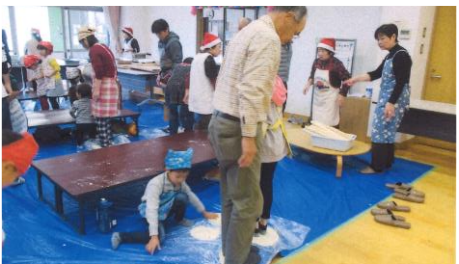
民生委員による「ふれあい交流会」 [東小川公民館]