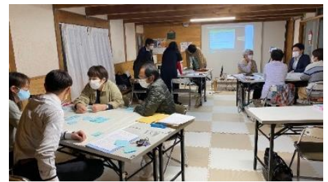
学習支援者養成講座 [さぬきっずコムシアター]