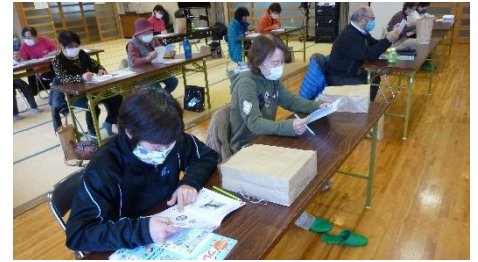
フレイル企画&シニアカフェ [垂水コミュニティ]