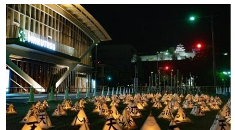
丸亀城宵あかり [マルタス]

第4次生涯学習推進計画は、市ホームページ、コミュニティセンター等でご覧いただけます。