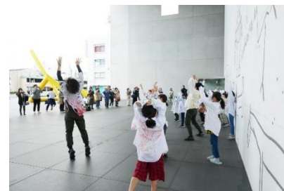
ダンスワークショップ 【丸亀市猪熊弦一郎現代美術館】