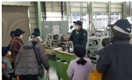
四国能開大見学ツアー [令和3年度市民学級の様子]