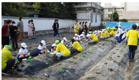
地域コーディネーター養成塾 [生涯学習課]