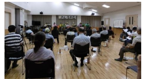
認知予防の集い うえるかむ [郡家コミュニティ]