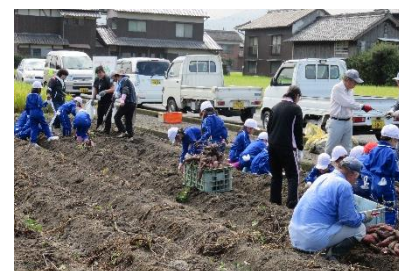
さつまいも栽培学習 【富熊コミュニティ】