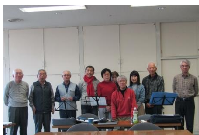
丸亀中央生涯学習クラブ [丸亀ハーモニカクラブ]

「いつでも」「どこでも」「誰でも」学べる環境を目指し、学習活動に携わる市民の拡充にも取り組んでいきます。