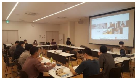
成人式打合せ [成人式実行委員会]