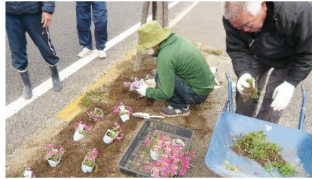
緑のまちづくり [土器コミュニティ]