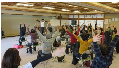
ロコモ予防体操 [富熊コミュニティ]