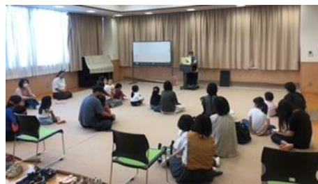
図書館うさぎ [中央図書館]