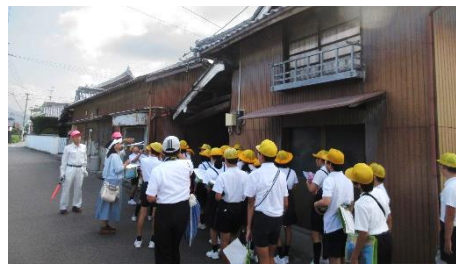
防災マップ作り [川西コミュニティ]