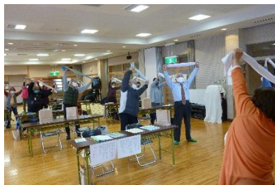
「垂水やすらぎサロン」シニアカフェと フレイル企画のコラボ【垂水コミュニティ】

学ぶ市民が増え、交流が深まることで多くの人や地域がつながり、市民が主体的に地域課題を解決するまちづくりへと進展していきます。