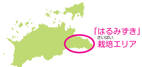
「はるみずき」栽培エリア