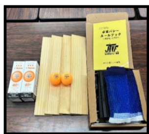
⑩卓球バレー 12組24本、ボール3箱、ネット2本

借用対象者：小中学校、幼稚園、保育所、こども園、コミュニティ、スポーツ団体 使用料金を徴取しないイベント開催時（個人による申請含む）