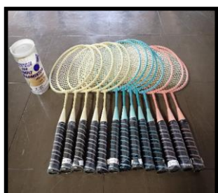
⑦ファミリーバドミントン ラケット13本、スポンジボール