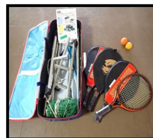
⑥バウンドテニス 1セット