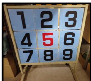
④ストラックアウト (白) マジックボール有 3セット