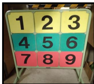
⑤ストラックアウト (緑) (白版よりやや小さめ) マジックボール有 2セット