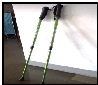
②ノルディック ウォーキングポール 30本