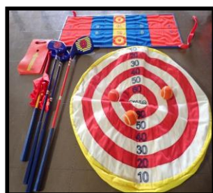
⑧スナッグゴルフ 1セット