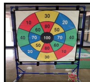
⑨ターゲットゲーム マジックボール有 1セット